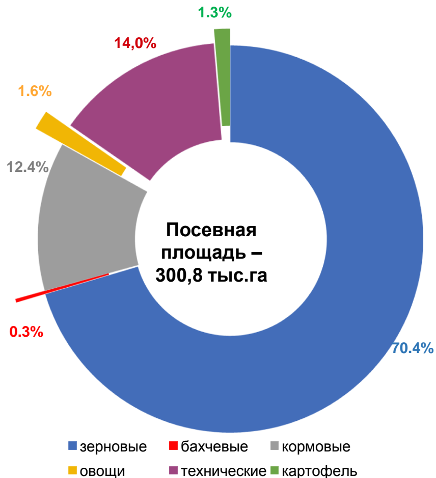
Структура посевных площадей в 2021 году (в % к итогу)